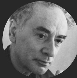
Ландау Лев Давидович

Своё название «Дом Дау» получил в честь прозвища легендарного академика Льва Ландау, основателя научной школы, лауреата Нобелевской премии.